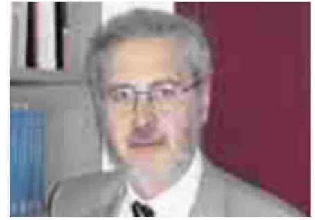
Il ministro Trigilia

PROGETTI MAI PRESENTATI E BUDGET POCO RIGOROSI: ECCO PERCHÉ SPENDIAMO SOLO IL 40% DEI SOLDI